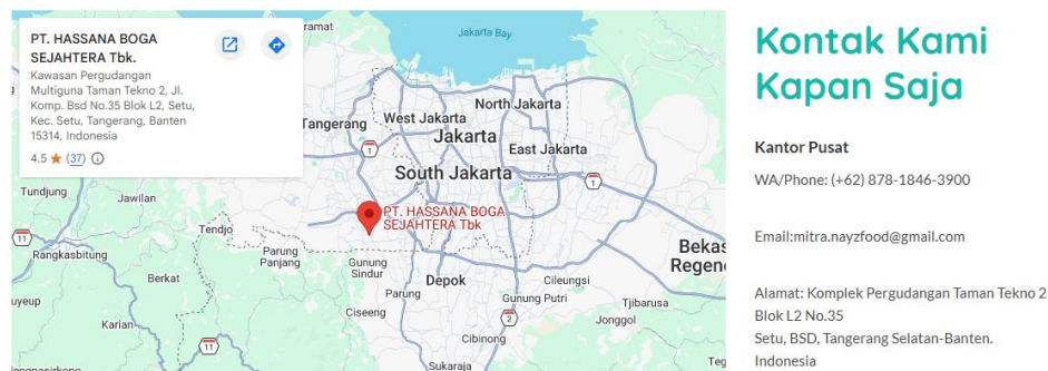
Gambar 4 Tampilan Landing Page Nayzspot.com