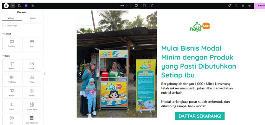
Gambar 2 Tampilan Pembuatan Halaman